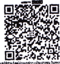
QR e-Donation บริจาคเงินผ่าน Application ธนาคาร

ให้ทุนการศึกษาพัฒนาเยาวชนให้มีคุณธรรมนำความรู้ คือกิจกรรมของมูลนิธิร่วมจิตต์น้อมเกล้าฯ เพื่อเยาวชนฯ