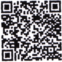
แบบตอบรับ