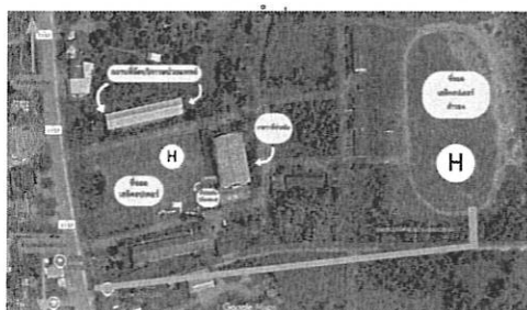
๑) โรงเรียนทุ่งกว๋าววิทยาคม อำเภอเมืองปาน จังหวัด