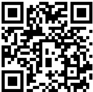
แผนที่กิจกรรม