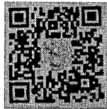
โปสเตอร์และแผ่นพับ