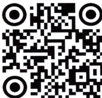
ดาวนโหลดเอกสารใบสมัคร