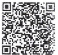
เอกสารแนบ

กองกลาง โทร. ๐ ๒๒๘๓ ๑๖๕๗ โทรสาร ๐ ๒๒๘๓ ๑๖๙๒