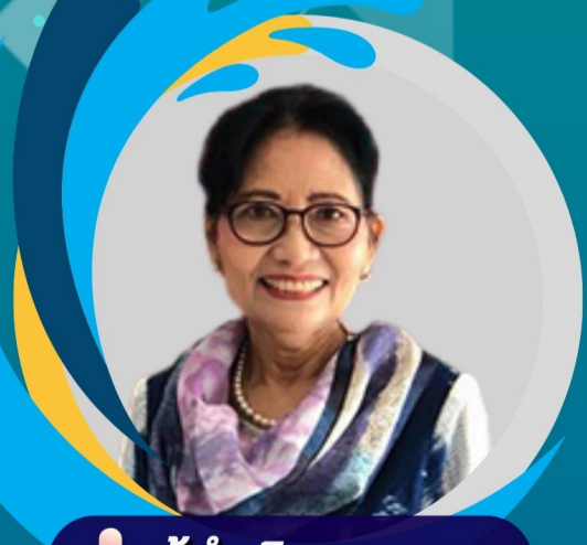
ผู้ดำเนินรายการ

การเสวนา เรื่อง “ การแลกเปลี่ยนประสบการณ์การเสนอบทความผลงานวิจัยทางด้านสังคมศาสตร์ ภาคบรรยายและภาคโปสเตอร์ ”