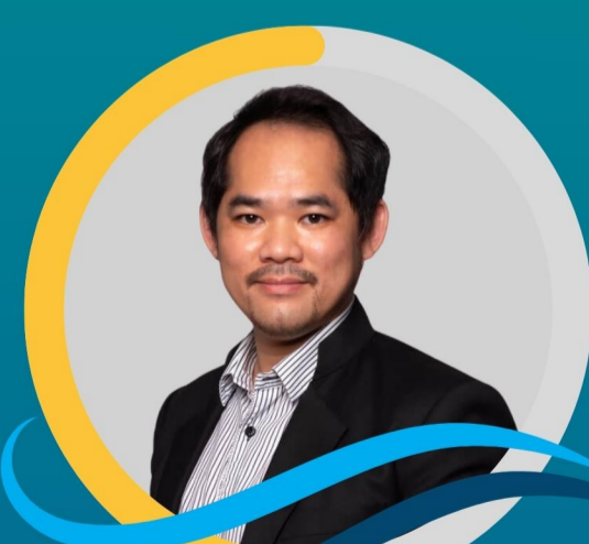
พศ.ดร.เฟ้าพันธ์ อานาจนันท์ มหาวิทยาลัยศิลปากร