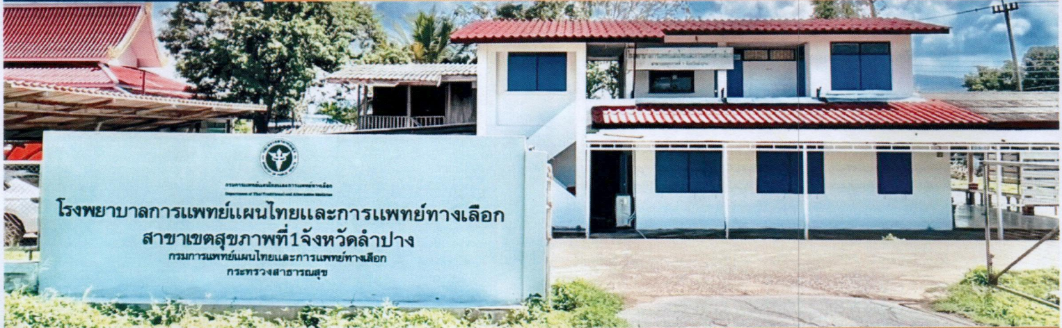
โรงพยาบาลการแพทย์แผนไทยและการแพทย์ทางเลือก สาขาเขตสุขภาพที่ 1 จังหวัดลำปาง