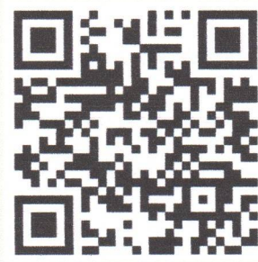
QR code ลงทะเบียน ร่วมสัมมนาออนไลน์