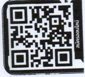
ช่องทางการสมัคร

วิทยาลัยเทคนิคมหาสารคาม ห้องประชุมชั้น 3 อาคาร 100 ปี 31 มีนาคม - 4 พฤษภาคม 2567 081-8733421 (กรุงเทพฯ) 089-9459331 (มหาสารคาม)