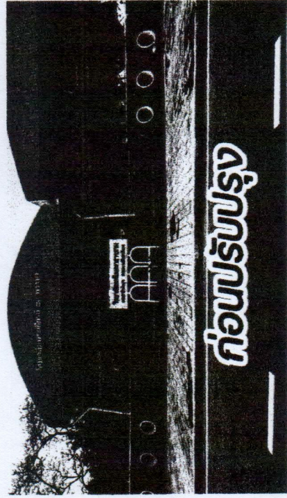
ก่อนปรับปรุง