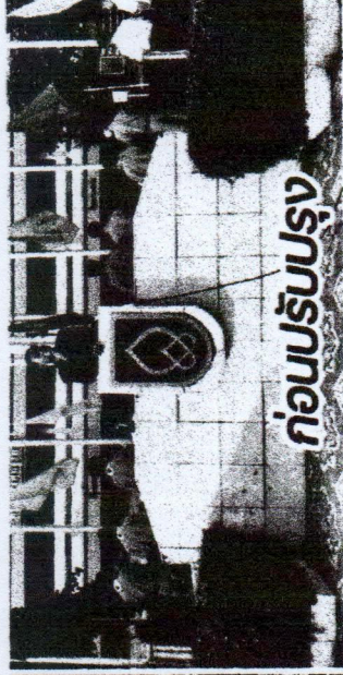
ก่อนปรับปรุง