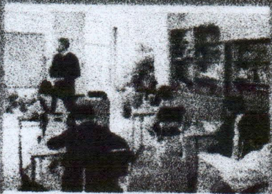
แบบประเมินตนเอง สำหรับสถานศึกษาดำเนินงาน อนามัยโรงเรียน ภาคเรียนที่ 2 ปีการศึกษา 2566

ประเมินตนเองสำหรับสถานศึกษาดำเนินงานอนามัยโรงเรียน ภาคเรียนที่ 2 ปีการศึกษา 2566 (ระหว่างเดือนพฤศจิกายน 2566 ถึง มกราคม 2567)