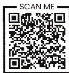
สำนักงาน Education Leaders Forum ลำปาง